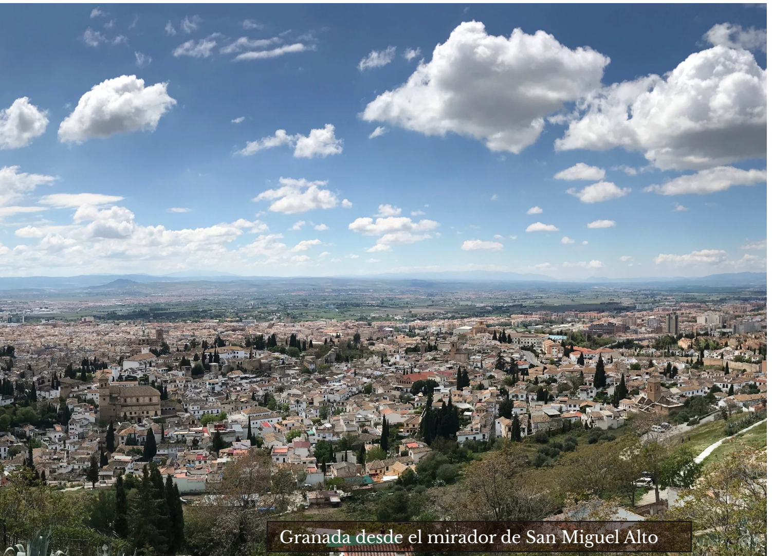
Granada desde el mirador de San Miguel Alto

Se recuerda el respeto de las medidas anti COVID-19