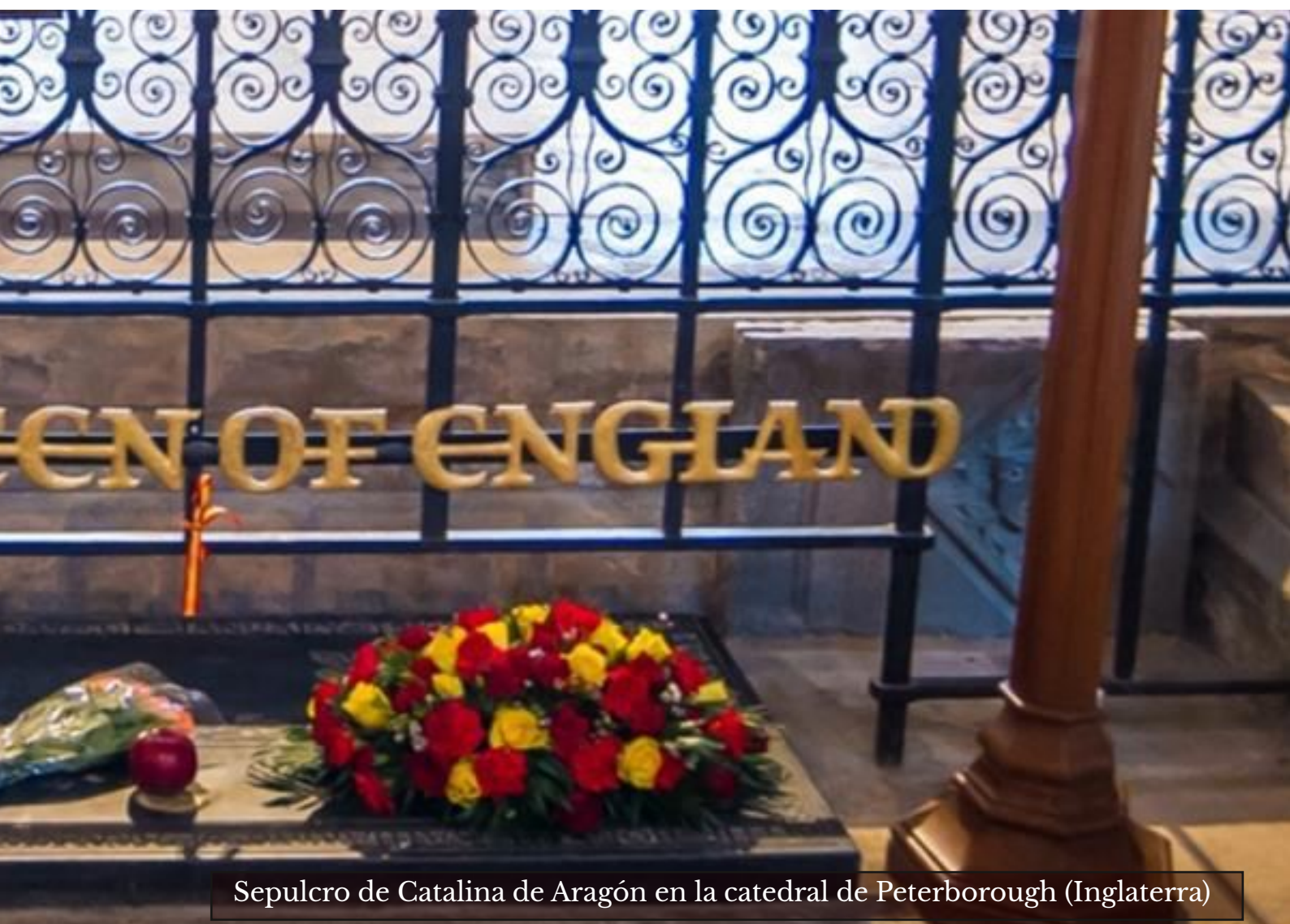
Sepulcro de Catalina de Aragón en la catedral de Peterborough (Inglaterra)