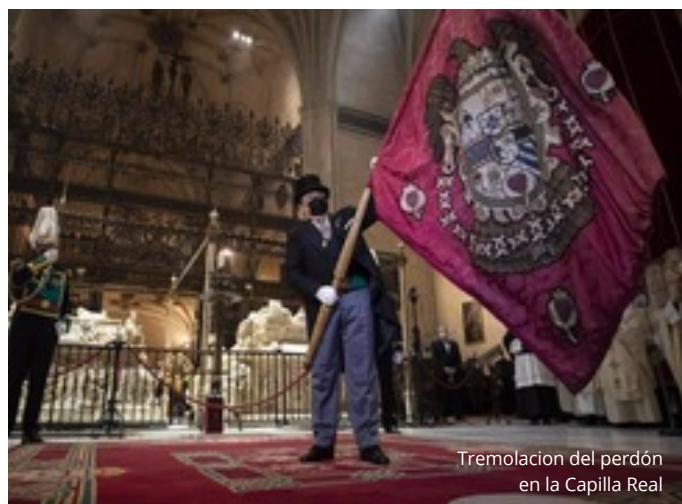
Tremolación del perdón en la Capilla Real

L a celebración de la festividad de la Toma viene produciéndose en nuestra ciudad ininterrumpidamente desde 1493, en conmemoración del hecho histórico de la tremolación de los pendones desde la torre de la Vela el 2 de enero de 1492, proclamando el fin de la empresa de reconquista. El ceremonial fue instaurado en su testamento por Fernando el Católico, fallecido en 1516, y ha ve-