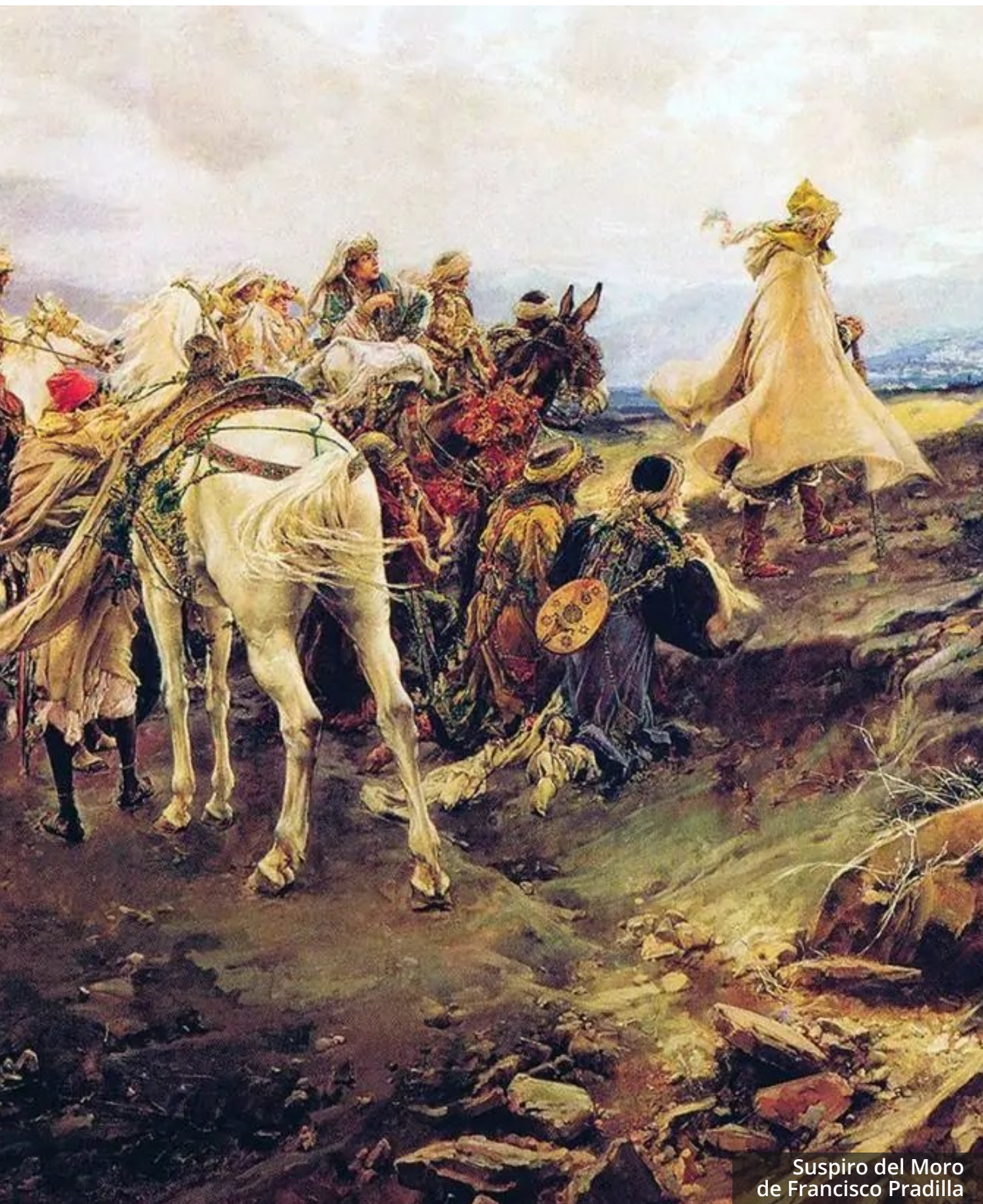
Suspiro del Moro de Francisco Pradilla