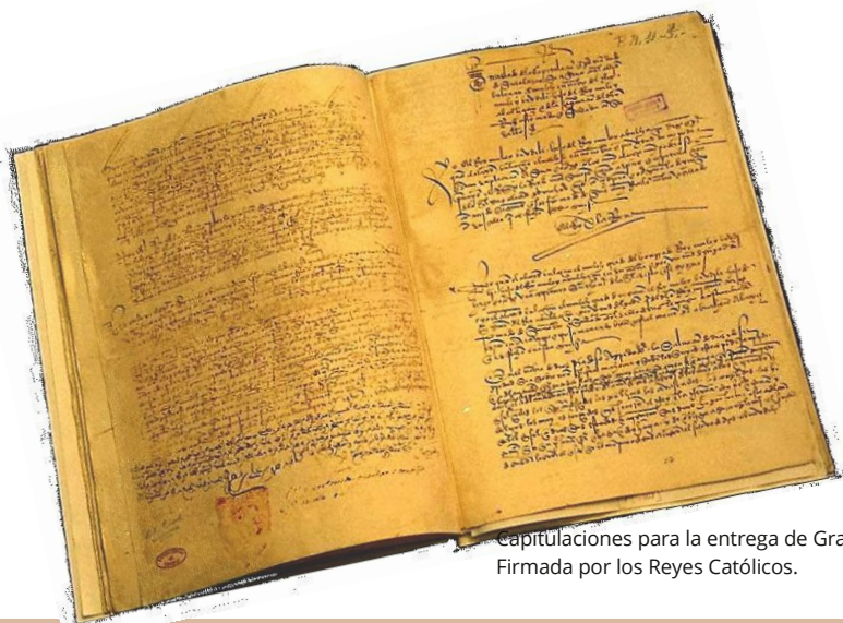
Capitulaciones para la entrega de Granada. Firmada por los Reyes Católicos.

No se debe de creer que Granada se regocijara de la rendición que sucedió en su ciudad, como lo hicieron los demás pueblos cristianos. Granada no celebró su entrega como se hizo en Roma por Inocencio VIII, ni como en Vitoria o en