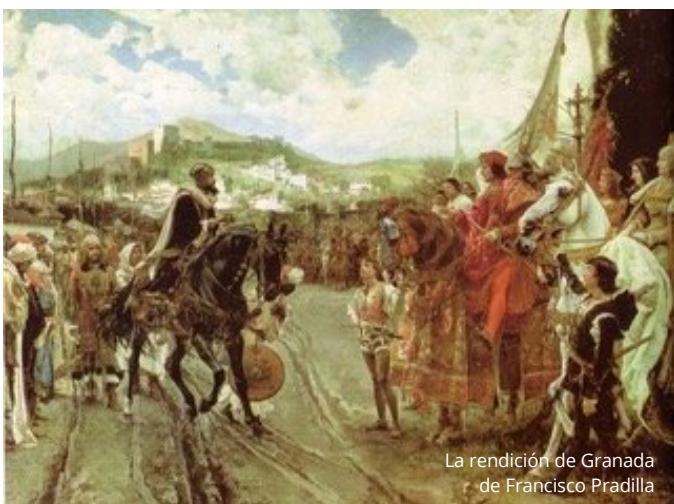
La rendición de Granada de Francisco Pradilla